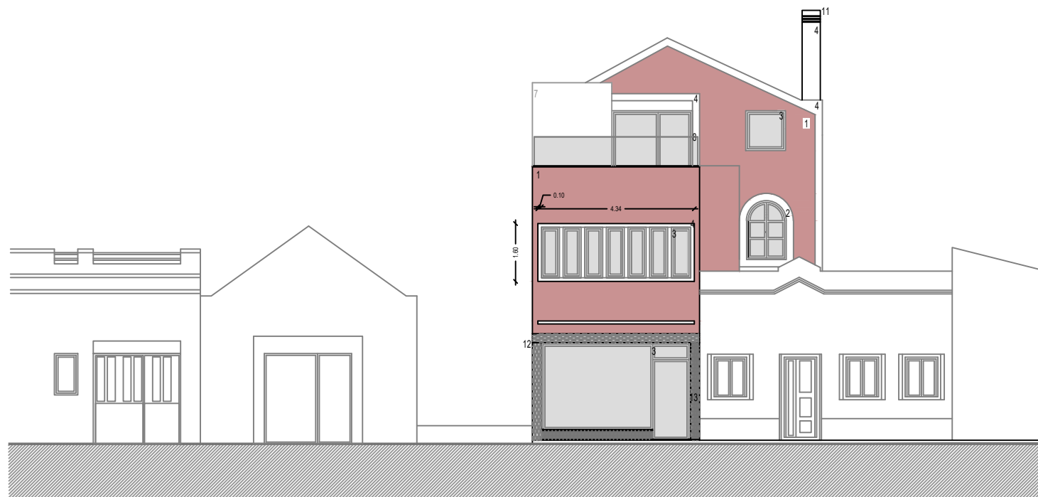
alçado da Rua dos Pescadores - secundario - poente